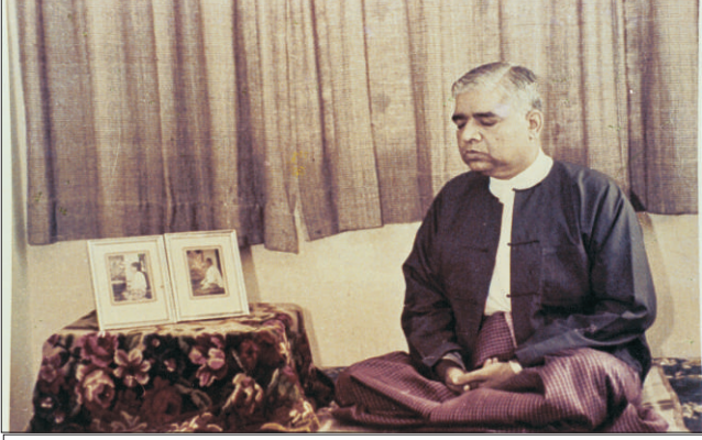
एका धर्मसभेत जाण्यापूर्वी ब्रह्मदेशी वेशभूषेत (ध्यानरत)