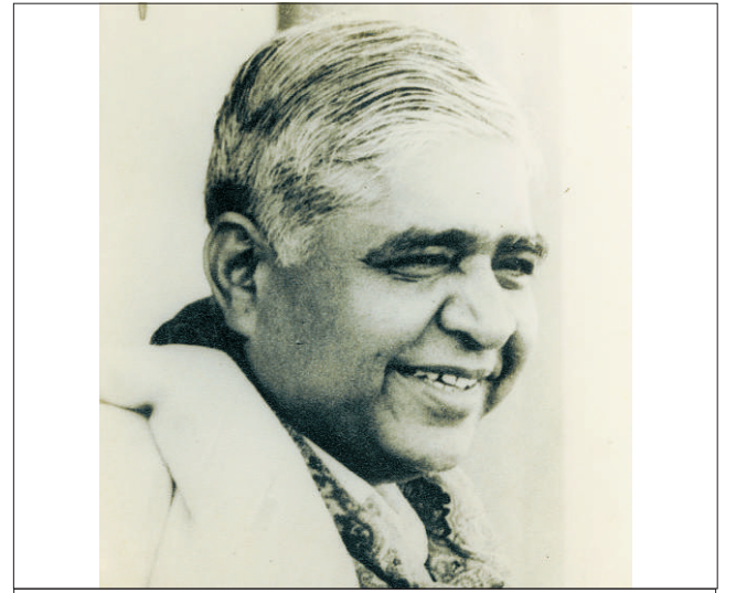
थंड वातावरणात एका अकेंद्रिय शिबिरादरम्यान