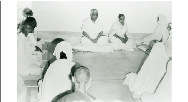
कच्छमध्ये जैन मुनी व साध्वींसोबत जमिनीवर ध्यानमग्न