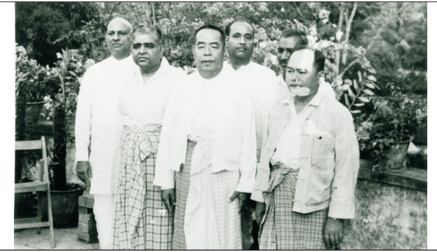
आंतरराष्ट्रीय विपश्यना केंद्रात सयाजी ऊ बा खिन व सहका-यांसोबत