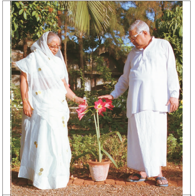
धम्मगिरीच्या फुलझाडांना मैत्री देतांना पूज्य गुरुजी व माताजी