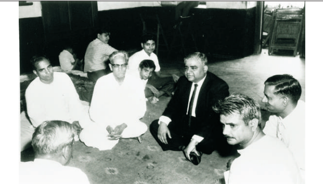
ब्रह्मदेशाच्या एका चर्चासत्रात विचार-विमर्श करतांना