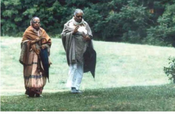
(धम्मधरा विपश्यना केंद्र, अमेरिकेच्या पॅरिसरात मंगल गैरी पाठ करताना, पूज्य गुरुदेव व माताजी १९८० च्या दशकामध्ये)

माध्यम आहे, धर्माला धन्यवाद द्या आणि स्वतःलाही कठोर परिश्रम केले त्यासाठी धन्यवाद द्या”.