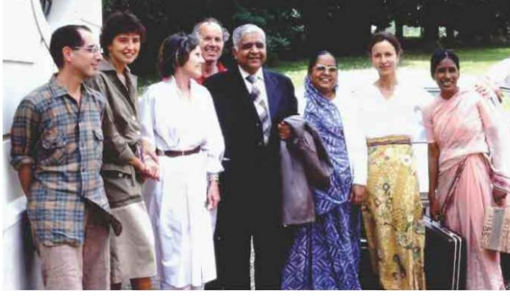
(गोड्यां, फ्रांसच्या पहिल्या शिबिराच्या समाप्तीवर साधकांरोबत १९९९)

जास्त सहायक आचार्य आहेत जे प्रत्येक वर्षी जवळपास २५०० पेक्षा जास्त शिबिरांचे संचालन करतात, जेथे जवळपास १५०,००० लोक १६० पेक्षा जास्त स्थायी केंद्रात व अस्थायी केंद्रात विपश्यना शिकण्यासाठी येतात. सन १९९४ पासून श्री गोयन्कार्जींनी खूप अनुभवी सहायक आचार्यांना आचार्यांच्या रूपाने नियुक्त केले. पूर्ण विश्वात जवळपास ३०० आचार्य आहेत जे संपूर्ण विश्वाच्या विपश्यना केंद्रांचे व अन्य विपश्यना शिबिरांच्या कार्यक्रमांना निर्देशित करतात.