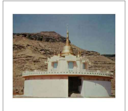
धम्मगिरी, इगतपुरीचा प्रारंभिक पंगोडा, १९७९

त्याच्याजवळ पैसे नव्हते. उदाहरणार्थ, नवीन बनलेल्या आचार्य निवासाचे पैसे देण्यासाठीही कोपात पैसे नव्हते. जेव्हा श्री गायन्काजींना हे माहीत