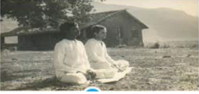
प्रारंभिक साधक, विद्यापीठाचे निर्माणकार्य सुरू होण्यापूर्वी जुन्या बंगल्याच्या बाहेर खुल्या जागेत ध्यान करताना

आधी बकऱ्या वगैरे ठेवत होते. घरातील फरशी शेणाने/ मातीने आच्छादली होती आणि भिंती अनेक वर्षे स्वयंपाक केल्याने धुरामुळे काळ्या झाल्या होत्या.