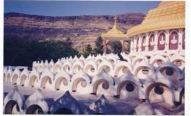
पहिल्या पगोड्याला खाल पासून वरपर्यंत झाकत बनवल्या गेलेल्या विशाल पगोड्यामध्ये एकूण 322 शून्यागार आहेत आणि 200 नवीन शून्यागार वेगळे बनविले आहेत.

निम्नलिखित अंश १९७९ मध्ये श्री गोयंकाजींद्वारे विपश्यनेच्या आचार्यांच्या रूपात त्यांनी दहा वर्ष पूर्ण केल्याप्रसंगी लिहिलेल्या एका लेखातून घेतले गेले आहेत:--