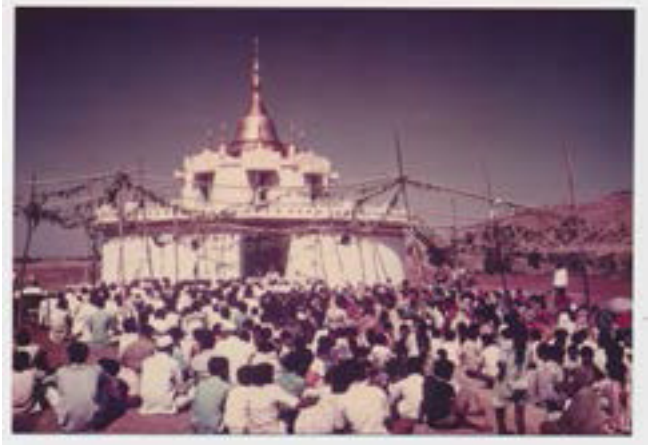
भारतातील पहिल्या पगोड्याच्या उद्घाटन प्रसंगी पूज्य गुरुजींचे सार्वजनिक प्रवचन, ज्यामध्ये गावातील लोकही आमंत्रित होते.

परंतु सर्वात महत्वपूर्ण विकास विटा आणि कॉन्क्रीट इत्यादींमध्ये नाही झाला तर साल दर साल धम्मगिरीमध्ये धर्माचे वातावरण मजबूत होत राहिले आहे. जशी साधकांना एकांतात राहण्याची आणि ध्यान करण्याची सुविधा वाढत गेली तसे श्री गोयंकाजींनी केंद्रामध्ये तीस दिवसांचे शिबिर संचालित करणे सुरु केले. १९८७च्या सुरुवातीला एका अधिक दीर्घ शिबिराची योजना बनवली आहे. जे लोक विद्यापीठात येतात, त्यांना अत्याधिक अनुकूल वातावरणात गंभीरतेने, गहन साधना करीत मुक्तीच्या मार्गावर पुढे जाण्याचा सुअवसर मिळत आहे. आज हे अनोखे केंद्र या गोष्टीचे अद्भुत उदाहरण आहे की परिश्रम आणि धर्माच्या बळावर काय नाही केले जाऊ शकत. विपश्यना साधना विश्वभरातील साधकांना अभ्यास करण्यासाठी परिपूर्ण समर्थन आणि प्रेरणा देत आहे.