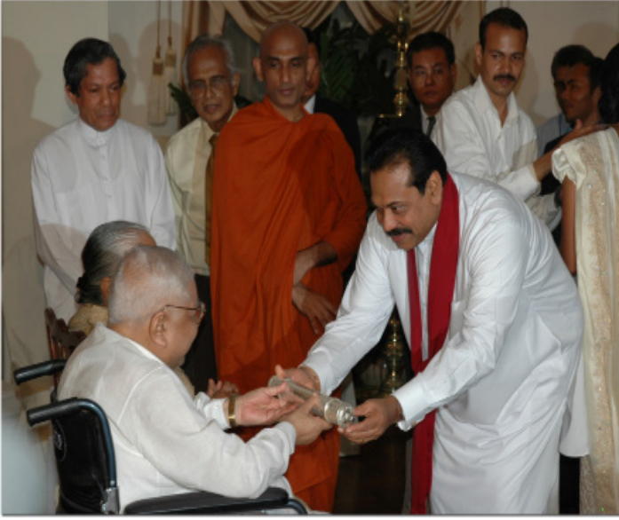
Sri Rajapaksha, President of Sri Lanka offering high title to Goenkaji

Thursday 18th MAY 2006 Registered in Sri Lanka as a Newspaper Vol.26 No.115 PRICE Rs.15.00