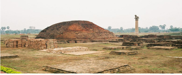
आनंद स्तूप, अशोक स्तंभ, वैशाली, बिहार

वैशाली में विपश्यना साधना के शिविर ‘महापजापति विपस्सना ट्रस्ट’ की देखरेख में 2017 से चल रहे हैं। जब एक शिविर ‘महापजापति वियतनामी भिक्षुणी संघ’ (Mahapajapati Vietnamese Nunnery) के आग्रह पर इस ननरी में लगा तो वे लोग इतनी लाभान्वित और प्रभावित हुईं कि तुरंत ही दुसरा शिविर लगाने का अनुरोध किया। फिर तो सभी लोगों को विपश्यना शिविरों में शामिल होने का प्रस्ताव पास हो गया और 500 लोगों के लिए बने भवनों के दो भाग करते हुए एक भाग ननरी ने अपने पास रखे और शेष भाग में नियमित रूप से शिविर लगाने की व्यवस्था करवा दी। इसके लिए समुचित गिफ्ट-डीड और ट्रस्ट-डीड बन गया। तब उपरोक्त ट्रस्ट ने कुछ और निवास, भोजनालय, कार्यालय आदि के साथ आधुनिक सुविधापूर्ण रसोईघर एवं कुछ अन्य आवश्यक निर्माण करवाये और विपश्यना केंद्र पूर्णतया सक्रिय हो गया। यहां लगभग 80 लोगों के लिए बड़ा हॉल और 20 लोगों का मिनी हॉल है तथा 40 पुरुष और 30 महिलाओं के निवास की पर्याप्त सुविधा है।